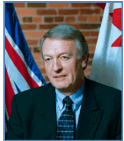
Errol Price, directeur principal au Bureau du vérificateur général de la Colombie-Britannique

Les lecteurs de L'Informateur sont déjà familiers avec les principes récemment publiés par la CCAF-FCVI pour guider la présentation de l'information sur la performance [voir encadré ou http://www.ccaf-fcvi.com/html/french/reporting_principles_entry.html ]. Le nouveau stade de publication d'informations que l'on vise par la mise en œuvre de ces principes s'articule autour de trois axes : une information davantage centrée sur les quelques éléments qui comptent réellement pour les Canadiens; une discussion plus approfondie des enjeux qui entrent en ligne de compte; et une plus grande transparence quant aux fondements du rapport produit, à ses forces et à ses limites.